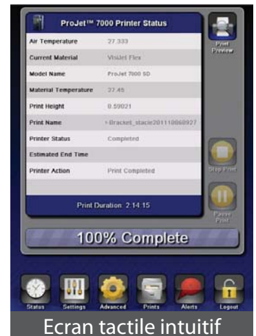
Écran tactile intuitif

Les imprimantes crossover ProJet sont disponibles en deux formats, proposent trois configurations d'impression haute définition et un vaste choix de matériaux VisiJet® SL, procurant notamment endurance, flexibilité, couleur noire, transparence, résistance en température, résistance aux chocs, applications dentaires et de bijouterie.