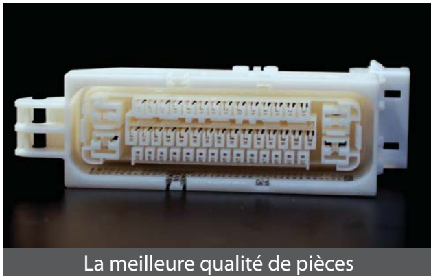
La meilleure qualité de pièces