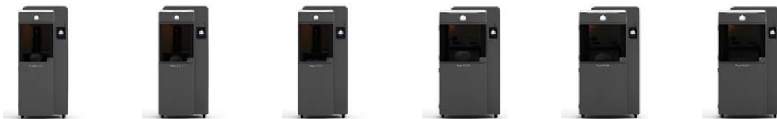
ProJet® 6000 SD ProJet® 6000 HD ProJet® 6000 MP ProJet® 7000 SD ProJet® 7000 HD ProJet® 7000 MP